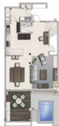
Ground floor plan Plan du rez-de-chaussée