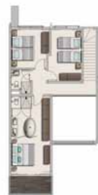
First floor plan Plan du premier étage