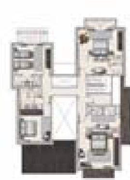
First floor plan - 5 bedroom option Plan du premier étage - villas de 5 chambres à coucher