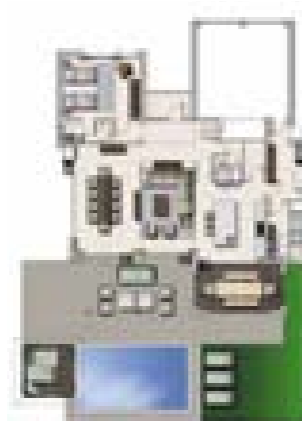
Ground floor plan - 5 bedroom option Plan du rez-de-chaussée - villas de 5 chambres à coucher