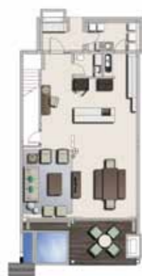
Ground floor plan Plan du rez-de-chaussée