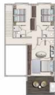
First floor plan Plan du premier étage